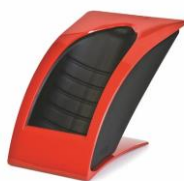
Gloss - Red 349,-