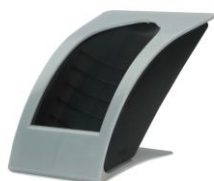
Pearl Grey 349,-