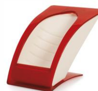
Sheer - Red 349,-