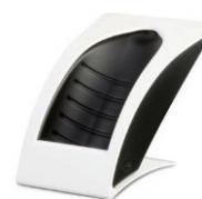
Gloss - White 349,-