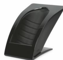
Gloss - Nero 349,-